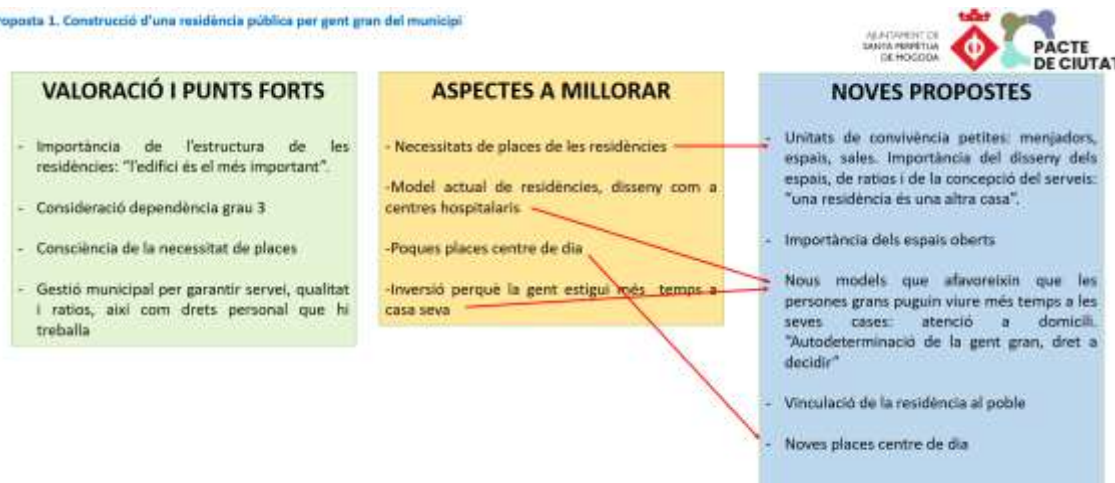
Proposta 1. Construcció d'una residència pública per gent gran del municipi

Com es pot constatar en l'anterior imatge va haver-hi unanimitat en el plantejament inicial del Pacte de Ciutat.