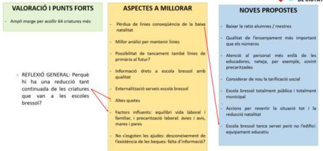
Proposta 5. Finançament de les escoles bressol municipals

La darrera part del debat es va centrar en els motius pels quals les escoles bressol tenen tant poca demanda tot i la natalitat existent i en quines mesures es podrien prendre per a augmentar-ne l'ocupació.